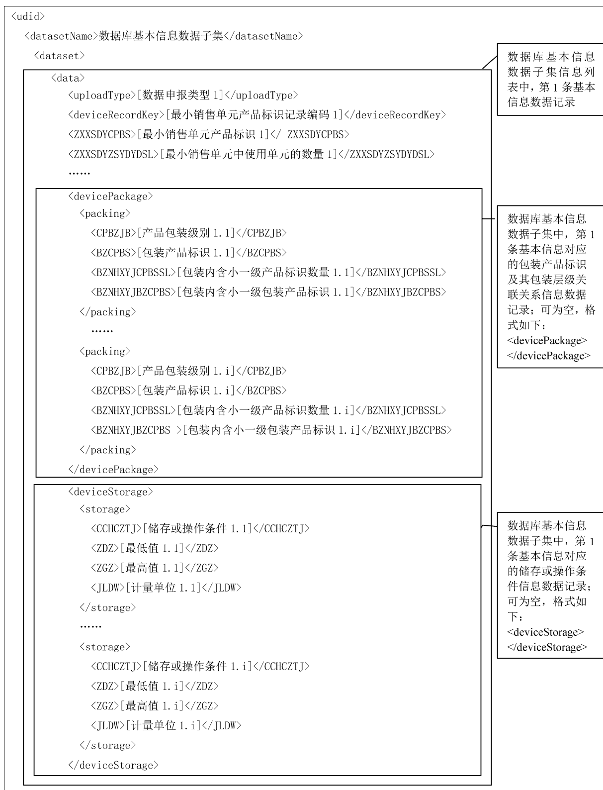
图 1 医疗器械唯一标识数据库基本信息数据子集对应的 XML 格式规则