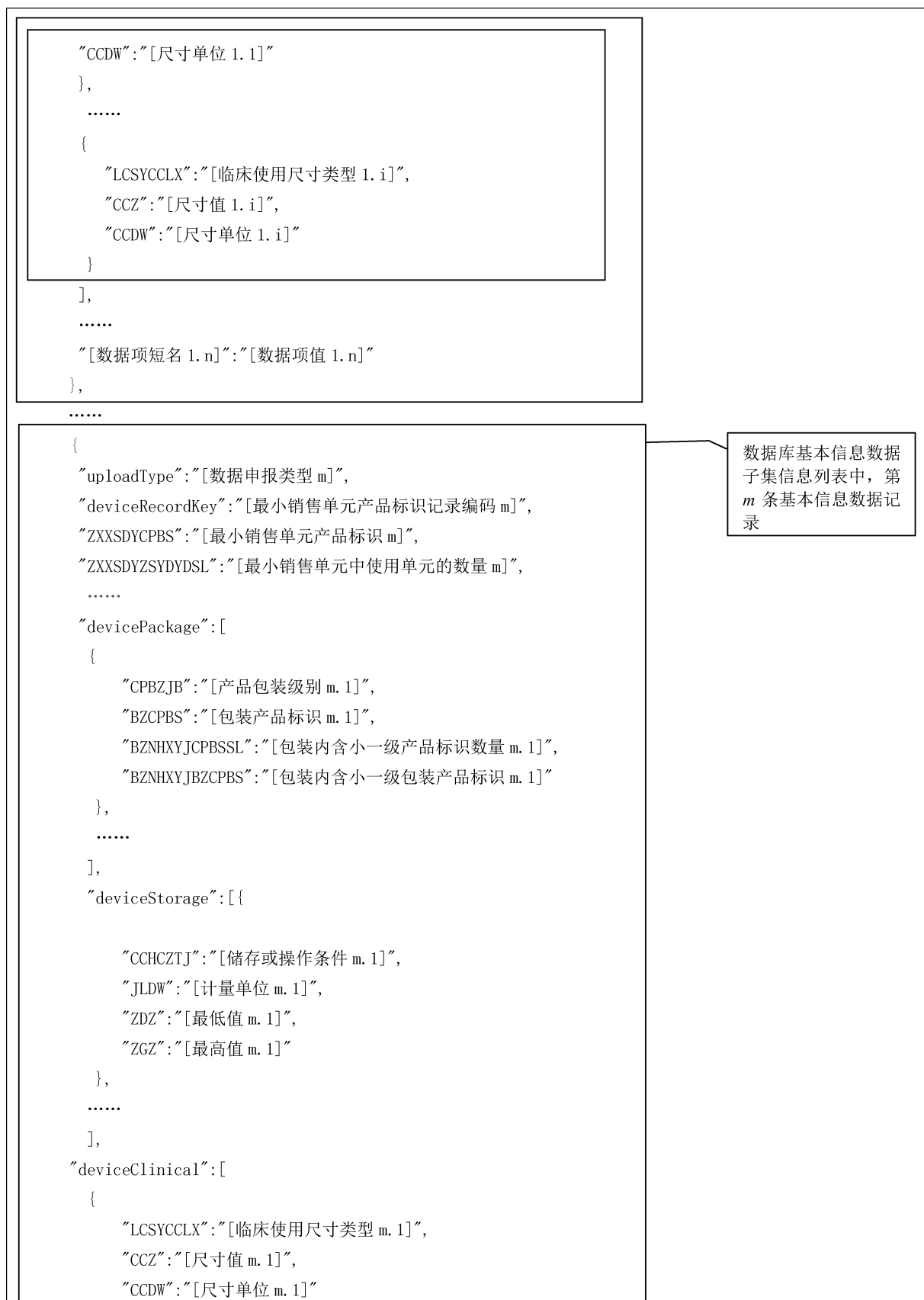
图 2 (续)